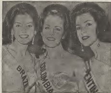
Esaki ta e tres bellezanan di Sur America cu a resulta e finalistanan den e concurso pa "Miss Universo".